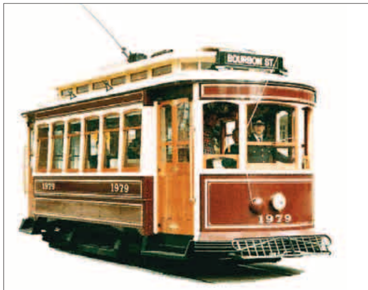
BERGENSTRIKK: Initiativtakerne sier det finnes forskjellige trikker over hele verden, og at Bergen kan få spesialbygd en helt egen bergentrikk.